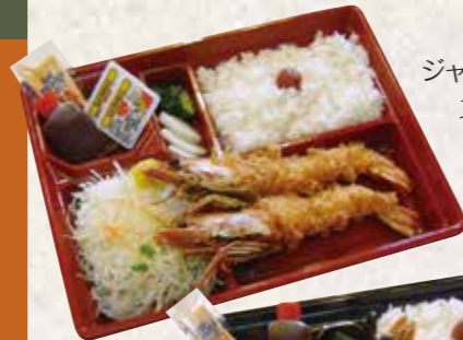
ジャンボエビフライスペシャル弁当