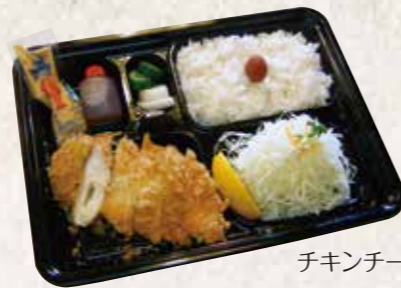
チキンチーズかつ弁当