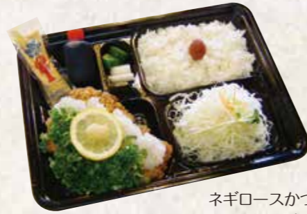
ネギロースかつ弁当 (140g)