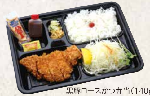
黒豚ロースかつ弁当(140g)