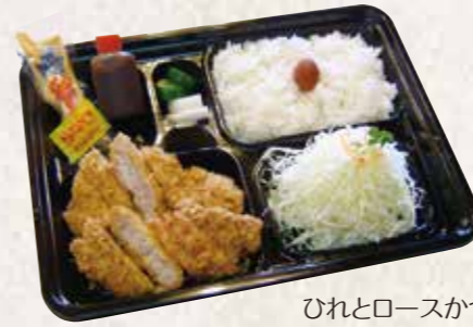
ひれとロースかつ弁当