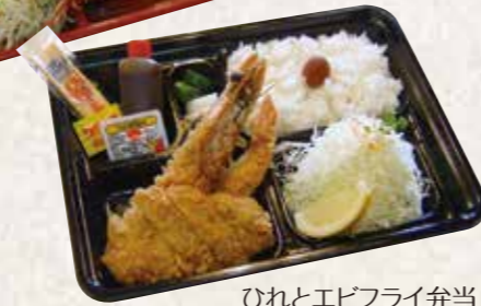
ひれとエビフライ弁当